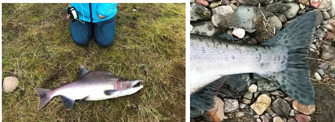
Bilder: Venstre: hannlaks med pukkel, høyre: spord på pukkellaks (her hunn)

Dersom du får pukkellaks: 1) slakt fisken og ta bilde, 2) ta skjellprøve, 3) legg inn fangstrappert samme dag med info om; dato-lengdemål-vekt-redskap-fiskested (elveierlag) – bilde, 4), informer leder / styret, eventuelt SUM så snart som mulig (91535921).