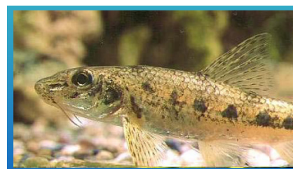
Sportsfiskeres spredning av sandkryper til Numedalslågen har redusert produksjonen av laks.

Høringssvaret ligger på http://lakseelver.no/Nyheter/2008/mars/Horing.htm