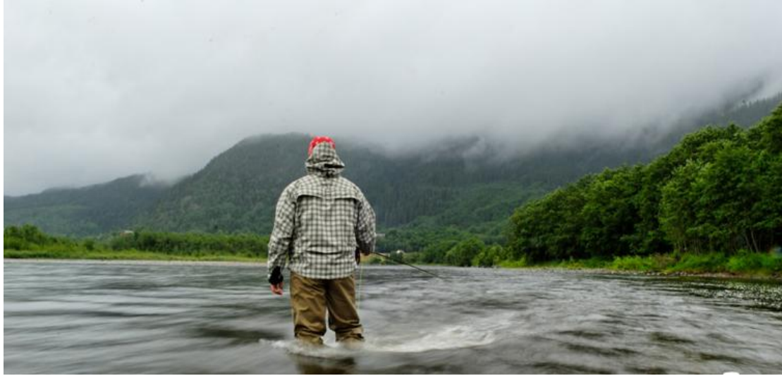
En fisker på Tranmæl strekka.