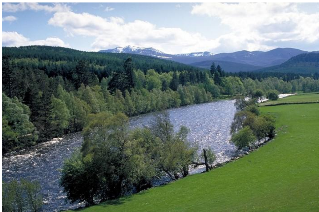
Bilde fra Upper-Dee Foto: www.gcof.no

Giver: Global v/Reid Hagelin, www.gcof.no