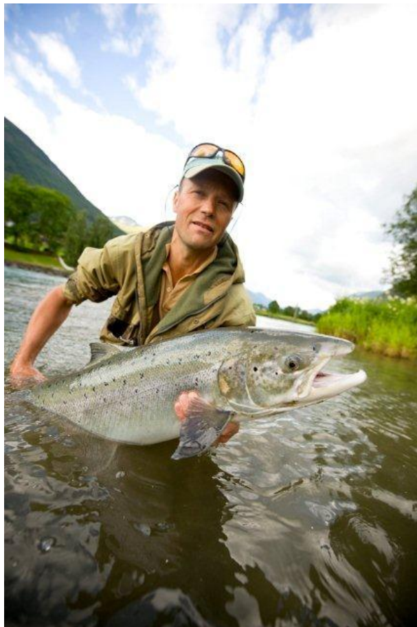
Storaks fra Skjolden.