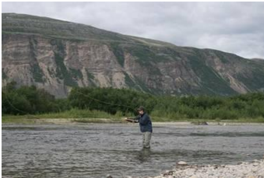
Fiske i Lakselv