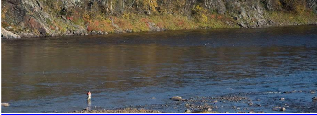
Fiske i Ponoir River.