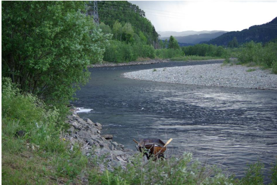
Utdrag fra valdet Ekli i Orkla