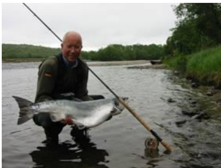
Storlaks fra Lakselva