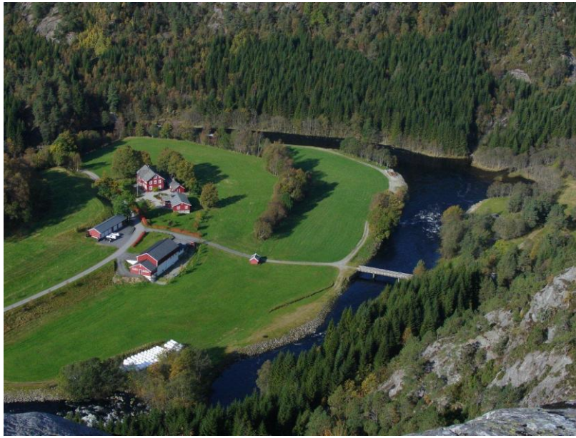
Osen Gard med Osenelva.

Fantastisk mulighet i august. 3 døgn, 7 - 10 august for inntil 6 personer i Osen i Sunnfjord - "den ukjente perlen"