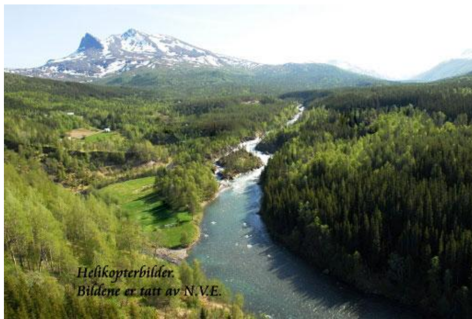
Hauforsett, Hauforsen og Solbakk. Foto: Hentet fra Tronesgrunneierlag sine hjemmesider

Giver: Trones Grunneigarlag, www.tronesgrunneierlag.no