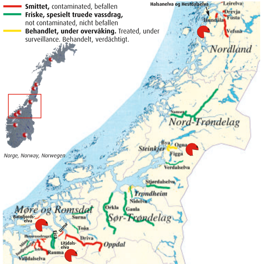
Utbredelse av G. salaris i Midt-Norge. The occurrence of G. salaris in Mid Norway. Die Ausbreitung von G. salaris im Mittel Norwegen.