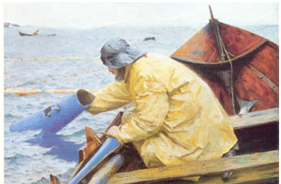
"Ute ved laksenoten" Fredrik Kolstø. Nasjonalgalleriet.

Gjennom utallige generasjoner har sjølaksefiske vært viktig for sjølberging langs Norges kyst. Det er lenge siden de første fangstredskaper ble satt i sjøen, redskaper som var temmelig lik noen av de som er i bruk i dag. Det er i dag ca 2000 aktive sjølaksefiskere i Norge. Antallet går sterkt nedover. Dette skyldes både nedgang i villaksbestandene og generell fraflytting fra distriktene.